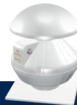
Wentylator dachowy promieniowy