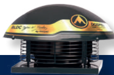
Wentylator dachowy promieniowy