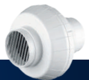
Wentylator kanałowy promieniowy