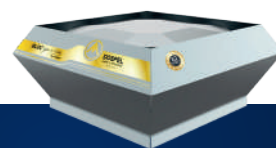
Wentylator dachowy promieniowy