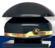
Wentylator dachowy promieniowy