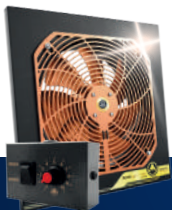
Wentylator rewersyjny nawiewno-wyciągowy